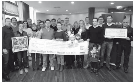
Spende der Firma Williams Lea