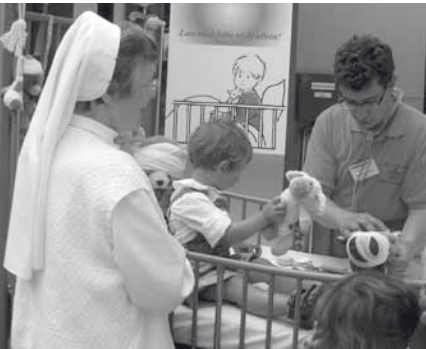
AKIK-Stand am Tag der offenen Tür „5 Jahre Lörracher Weg“ am St. Elisabethen-Krankenhaus

Einen lang geplanter AKIK-Elternabend wurde uns von seiten eines Kindergartens leider mit der Begründung wieder kurzfristig abgesagt: „Kein Elternteil hat sich für den Infoabend in die Liste eingetragen!“