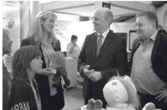
Stadtkämmerer Becker am Tag des Bürgerengagements

Auch in diesem Jahr durfte sich das Aktionskomitee KIND IM KRANKENHAUS Bezirksgruppe Frankfurt e.V. mit einem Stand im Frankfurter Römer anlässlich des Tags des Bürgerengagements präsentieren. Viele gute Kontakte konnten neu geknüpft werden und bestehende Kontakte zu verschiedenen Vereinen und Verbänden wurden vertieft. AKIK-Betreuerinnen konnten interessierten Menschen von unserer Arbeit berichten.