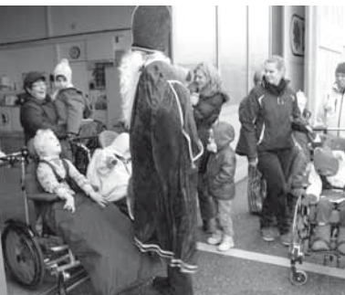
Nikolausfeier am Freiburger Flugplatz mit geistig und mehrfach behinderten Kindern