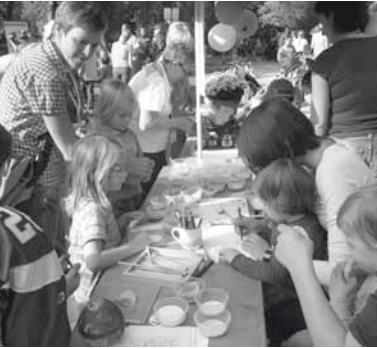
Tag des Kinderkrankenhauses im Günthersburgpark

Zum 18.9.2011 dem „ Tag des Kinderkrankenhauses “ haben wir dank der Einladung des Kinderschutzbundes Frankfurt einen Informationsstand im Günthersburgpark aufgestellt. Der Bundesverband veröffentlichte eine Pressemeldung und die Kinder durften sich Buttons selber gestalten.