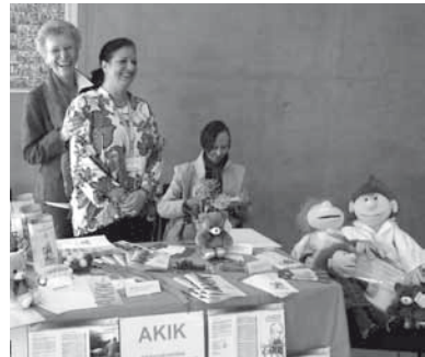
Informationsstand im Bürgerhospital