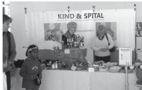
Besuch am Stand Kind & Spital am Internationalen Tag des Kindes im UKBB Basel

Einen weiteren Besuch machten wir im UKBB am Internationalen Tag des Kindes. Mit vielen ideenreichen und bunten Aktionen wurde auf die Rechte der Kinder aufmerksam gemacht. Es ist immer wieder eine große Freude, wenn wir uns über die Grenze hinweg gegenseitig austauschen und herzlich willkommen heißen können.