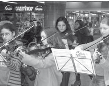
Orchestermitglieder der Carl Schurz Schule

Auch ein aussichtsreicher Kontakt zu einer in Frankfurt tätigen Firma konnte geknüpft werden. Vielleicht werden wir im nächsten Jahr gemeinsam die Rettungsteddies verpacken, wir würden uns freuen.