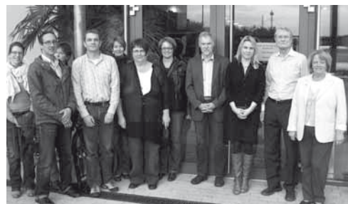
Besichtigung und Information bei der Firma Osypka AG Medizintechnik in Rheinfelden mit den Mitarbeitern im St. Elisabethen-Krankenhaus Lörrach

Unser Landesschatzmeister organisierte für Mitarbeiter des St. Elisabethen-Krankenhauses Lörrach einen Firmenbesuch bei der Firma Osypka AG Medizintechnik in Rheinfelden. Ganz aktuell konnten wir vom Firmenchef über die aktuelle Entwicklung von Babydraht für Herzkatheter informiert werden. Eine Führung durch die Firma und eine Einladung unseres Chefarztes zum Abendessen rundete den sehr informativen Nachmittag ab.