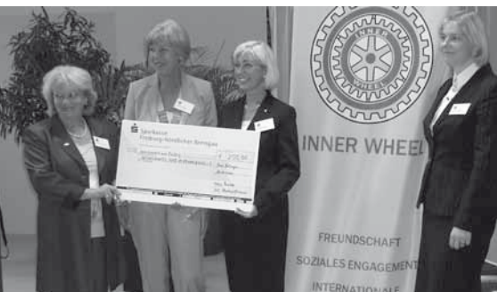
Spende an AKIK des Inner Wheel Club Markgräflerland e.V.