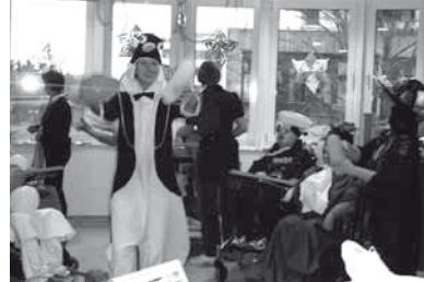
Faschingsfeier im Haus Zwergnase

Das Bürgerhospital hat sich mit dem Clementine Kinderhospital zu den „Stiftungskrankenhäusern“ zusammengeschlossen. Da es sich für unsere Arbeit überwiegend um Geburten mit mehreren Kindern handelt, bei denen die Familien oft selber die Versorgung übernehmen, wurden wir nur in Einzelfällen um Hilfe gebeten. Diese Unterstützung ist dann aber gerne gewünscht, gebraucht und wird mit Freude angenommen. Es besteht ein regelmäßiger Austausch zwischen AKIK und dem Krankenhaus.