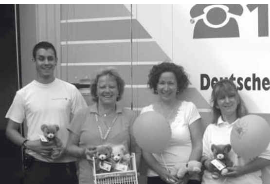
AKIK schenkt den 20.000 Rettungst Teddy an das DRK Ortsverein Rheinfelden

Hervorzuheben ist eine sehr großzügige und zweimalige Spende von den Damen des Inner Wheel Club Markgräflerland e.V. nach dem Motto: „Wir lassen Euch Kinder im Krankenhaus nicht alleine!“. Auch über private kleinere Einzelspenden und Bußgelder vom Amtsgericht Waldshut/Tiengen konnten wir uns freuen.