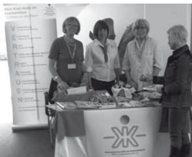
14. bundesweiten Tag des Kinderkrankenhauses in der Stadtklinik Baden-Baden

Das Jahr 2011 war für die AKIK-Gruppe Gaggenau/Baden-Baden/Rastatt in vielerlei Hinsicht erfolgreich. So konnte unser „Standard-Programm“, der Bücherdienst in der Klinik für Kinder und Jugendliche Baden-Baden, trotz des recht kleinen Aktivenstammes weitergeführt werden. Durch den umfangreichen Ankauf neuer, auch fremdsprachiger Bücher und die reichhaltige Spende einer in Baden-Baden ansässigen Kinderbuchhandlung, wurde das Angebot noch attraktiver.