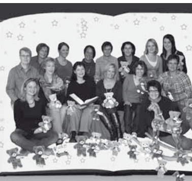
Weihnacht Spendenaktion der Stadtapotheke Kuppenheim + Rastatt/Niederbühl

Als neue Verkaufsstelle für unseren Rettungsteddy® konnten wir die Cafebetreiber in der Stadtklinik gewinnen. Der Verkauf läuft sehr gut.