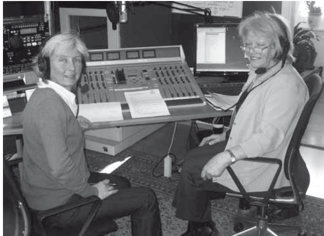
AKIK wird von Radio Schopfheim zu Aufgaben und Ziele interviewt

Im regionalen Rundfunksender „Freies Radio Schopfheim“, sprachen wir zwei Stunden mit einer Redakteurin über die Inhaltsarbeit des AKIK.