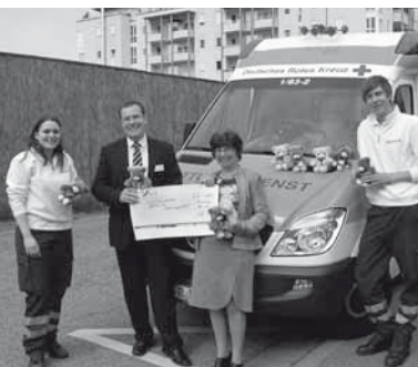
Filialdirektor der BBBank übergibt eine Spende für den Rettungst Teddy®

Im April konnten wir vom Filialdirektor der BBBank eine Spende für den Rettungst Teddy® entgegennehmen. Auf Einladung der Fastnachtsgruppe „Merzhuser Bäretreiber“ hatten wir einen Teddy- und Infostand beim Kindermaskenball.