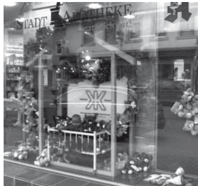
AKIK Schaufenster Weihnachtsaktion der Stadtapotheke Kuppenheim

Die Kontaktpflege unter den AKIK-Aktiven und den Mitarbeitern der Klinik für Kinder und Jugendliche in Baden-Baden war auch im Jahr 2011 sehr intensiv, ebenso fand auch im vergangenen Jahr mit anderen Ehrenamtlichen in der Kinderbetreuung und in Selbsthilfegruppen ein reger Informationsaustausch statt.