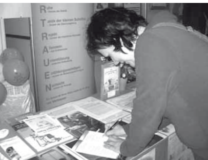
Ein neues AKIK-Mitglied wird auf der Gesundheitsmesse gewonnen

Auf der Gesundheitsmesse „Gesunde Zeiten“ im Burghof in Lörrach waren wir zum 6. Mal in Folge wieder aktiv dabei. Am Standplatz 1 ließen die beiden Veranstalterinnen AKIK einen besonderen Stellenwert zukommen. Mit freundlicher Genehmigung des AKIK-Bundesvorstands informierten wir die Besucher anhand von Power Point Folien über das Thema „Kindsein – Kranksein“.