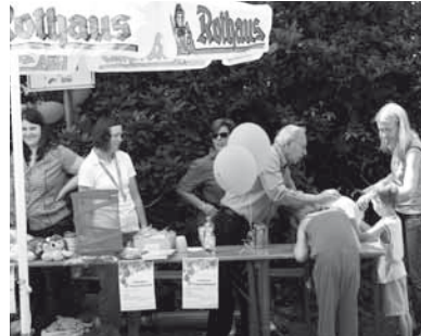
Sommerfest der Unikinderklinik am AKIK Stand mit Luftballonwettbewerb

Auf der 2-tägigen Baby+Kind-Messe in Freiburg waren wir auch mit einem Infostand dabei. Bei dieser Veranstaltung sind vor allem junge Eltern und es ist eine sehr gute Möglichkeit, diese über die Arbeit von AKIK zu informieren.