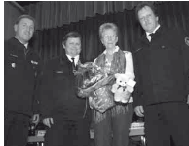
AKIK-Bezirksgruppe Frankfurt e.V. wird Mitglied im Kreisfeuerwehrverband