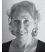
Angelika Fackler Bundesvorsitzende