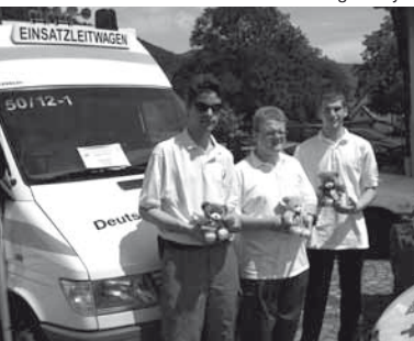
Tag der offenen Tür bei der Feuerwehr und DRK Glottertal

Im April konnten wir vom Filialdirektor der BBBank eine Spende für den Rettungst Teddy® entgegennehmen. Auf Einladung der Fastnachtsgruppe „Merzhuser Bäretreiber“ hatten wir einen Teddy- und Infostand beim Kindermaskenball.